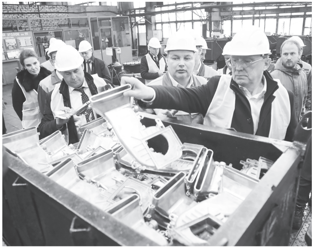
ООО «Димитровградский литейный завод» увеличило в 2022 году выпуск продукции на 73%.

Добавим, в Лутугине готовится к открытию дилерский центр, где можно будет приобрести ульяновские предметы интерьера, мебель, двери, отопительное оборудование, стройматериалы, продукты питания и другие товары.